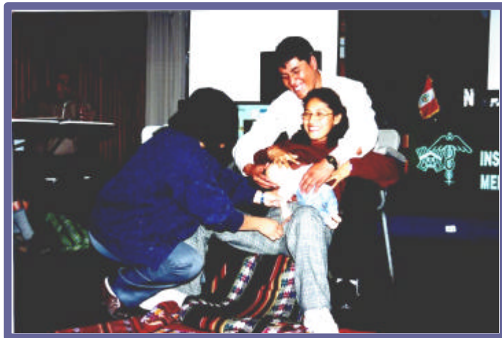
Demostración de un parto atendido en el Hospital Regional del Cuzco, en el que participaron; la parturienta, el esposo de la parturienta y la obstetrix.