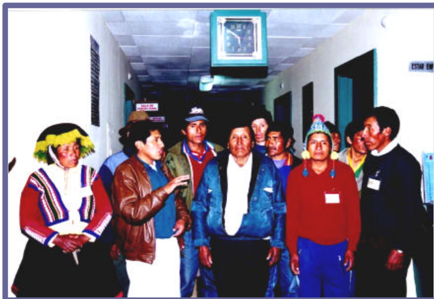
Visita a las instalaciones del Hospital Regional del Cuzco, llevado a cabo en el Tercer taller, los parteros orientados por un personal de salud quien le hace conocer las instalaciones.