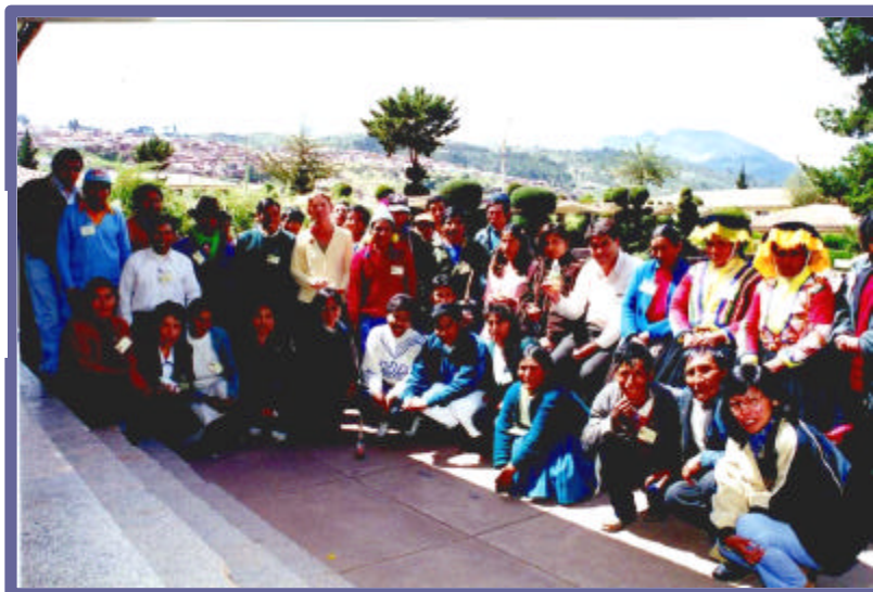
Segundo Taller – Hospital Regional