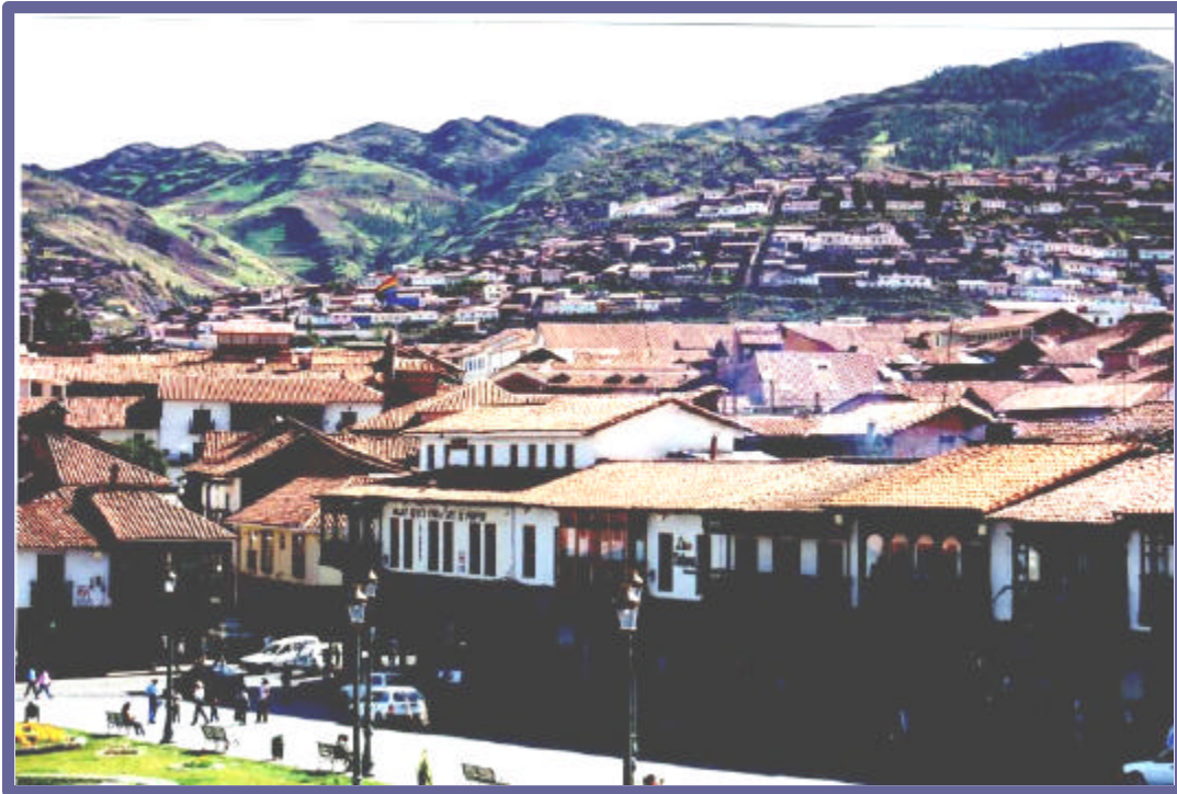
Una vista de la Ciudad del Cuzco desde la Plaza de Armas