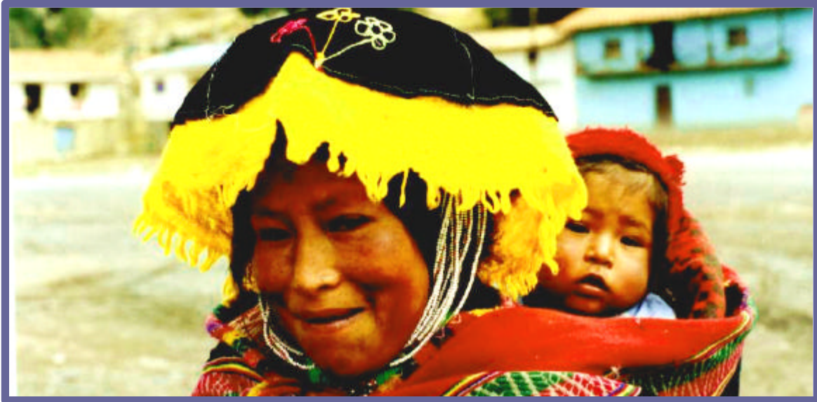
Rostros de personajes oriundos de la Provincia de Quispicanchi en la ciudad