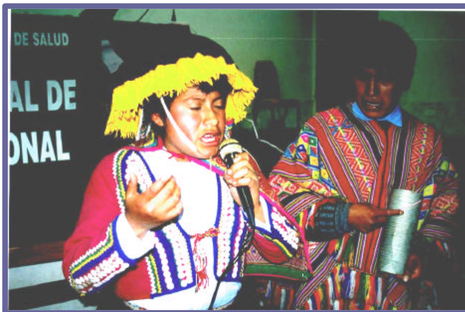
Música y baile, a la finalización del taller, momentos de alegría y distracción con el acompañamiento de un grupo musical.