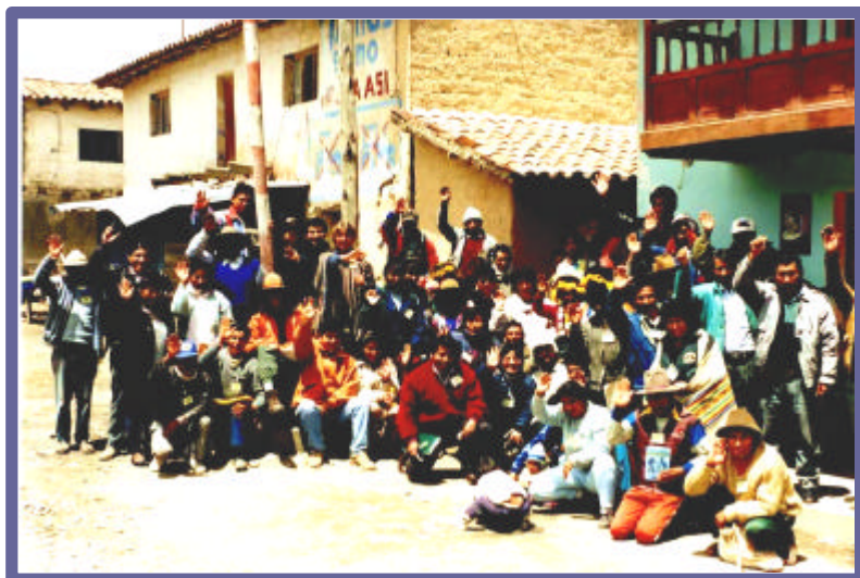
Primer taller – Comunidad de Tinki - Quispicanchi