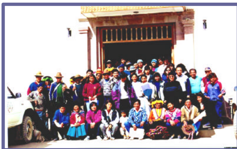
Tercer Taller - Ocongate