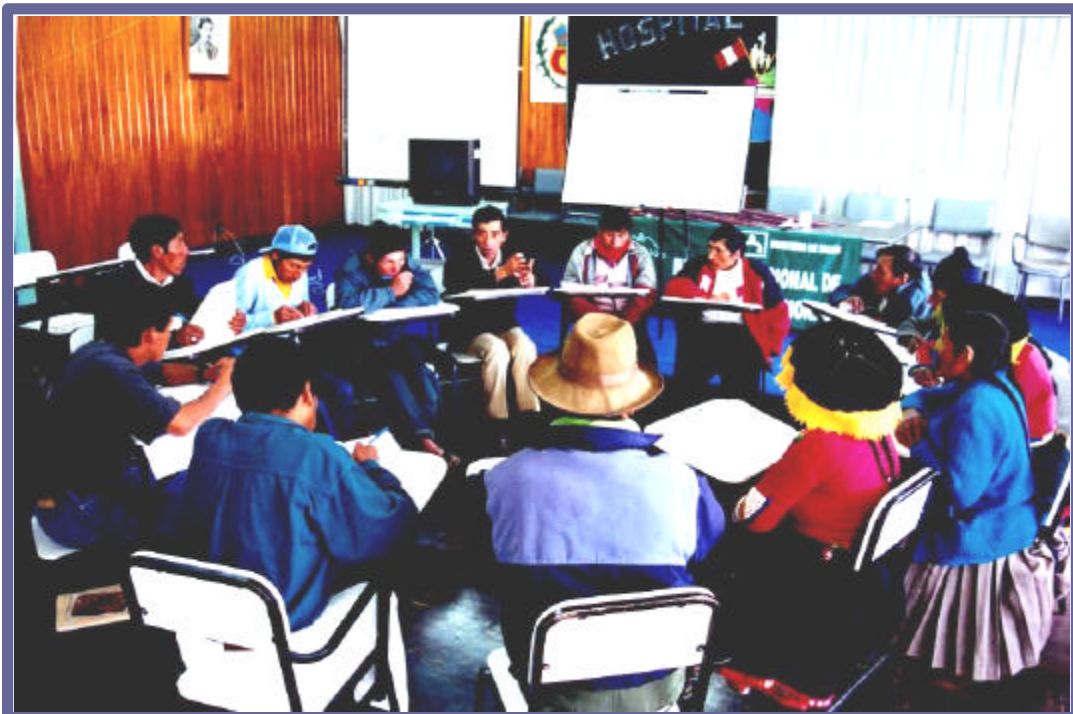
Parteras y personal de salud intercambiando conocimientos, experiencias y tratando de encontrar soluciones a los problemas en conjunto